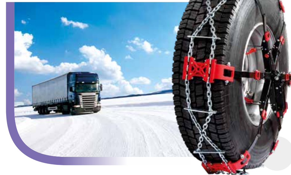
Polaire Steel Truck*