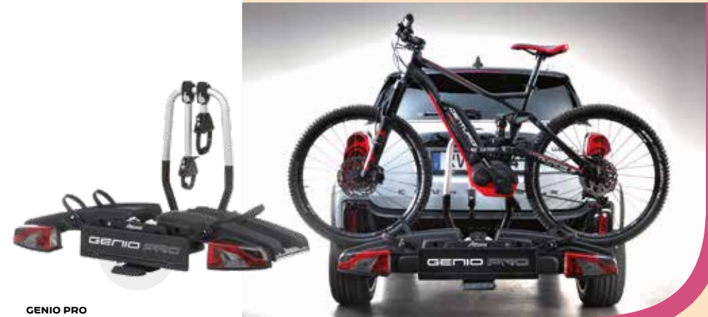
GENIO PRO Il permet de transporter jusqu'à 2 vélos Available for 2 bikes