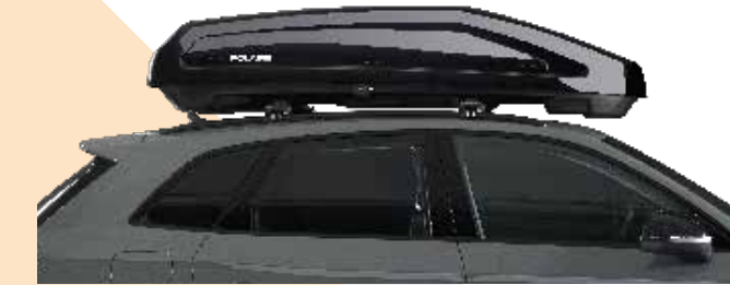
Collection Inspiration • C400-INNA : 400 L • C470-INNA : 470 L • C550-INNA : 550 L