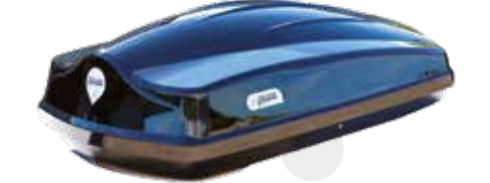
Collection Voyager • Vona C440 : 300 L • Vona C580 : 450 L • Vona C340 : 500 L